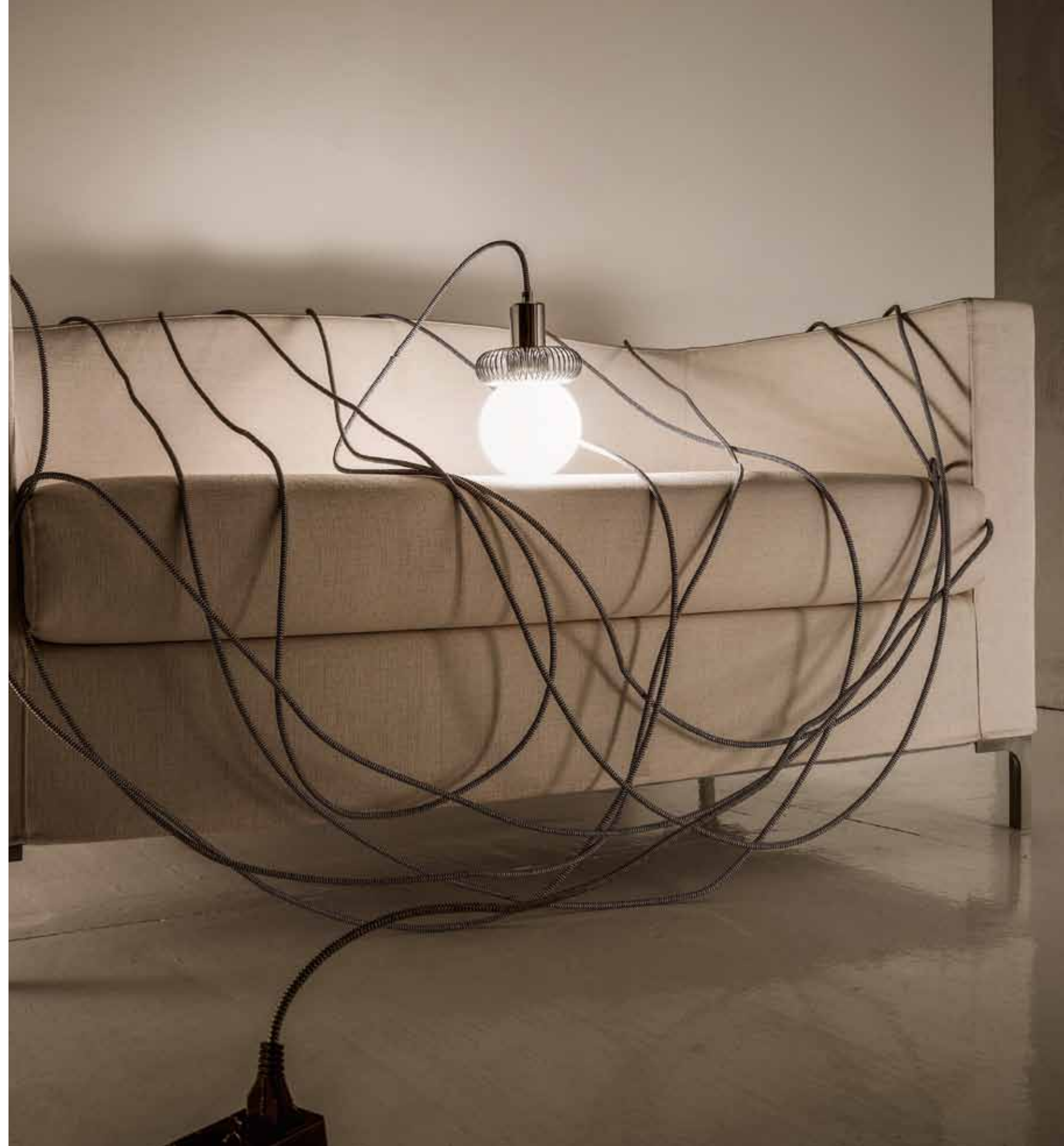
table lamp with timeless style